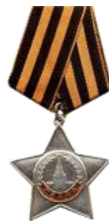
Орден Славы III степени