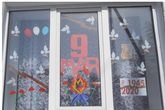
Рисунок размещается на окне дома, чтобы прохожие видели рисунок.

Можно сделать рисунок на военную тему, либо по мотивам недавно просмотренного фильма или прочитанной вместе с ребенком книги.