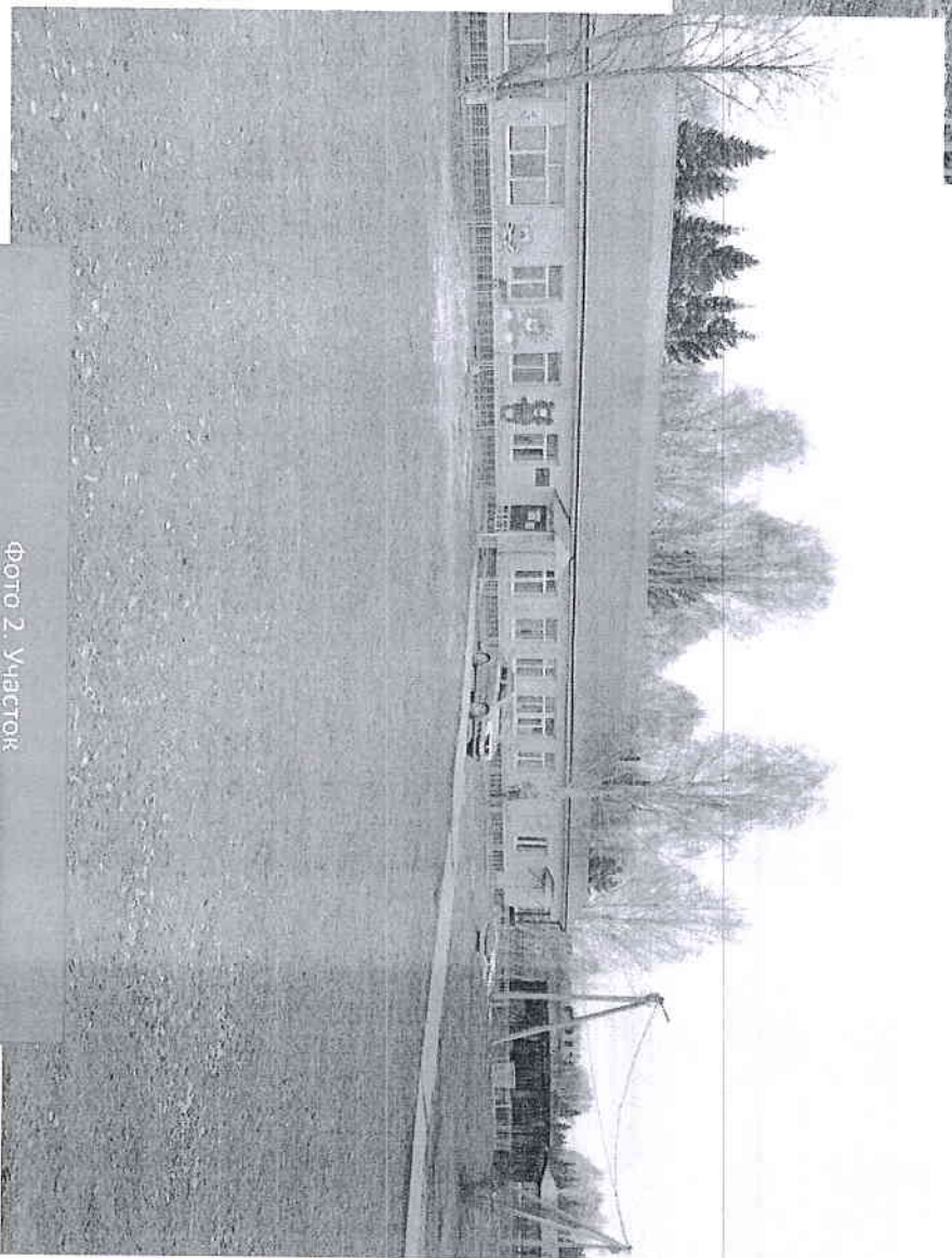
Фото 2. Участок