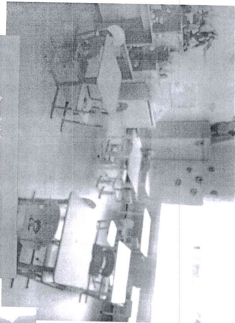
Фото 3. Кабинет старшей группы