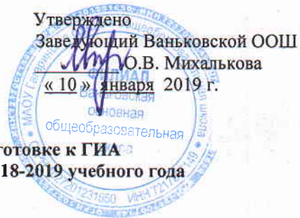
График консультаций по подготовке к ГИА учащихся 8 класса во II полугодии 2018-2019 учебного года