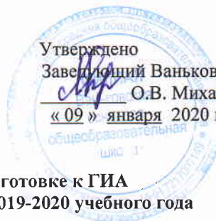
График консультаций по подготовке к ГИА учащихся 8 класса во II полугодии 2019-2020 учебного года