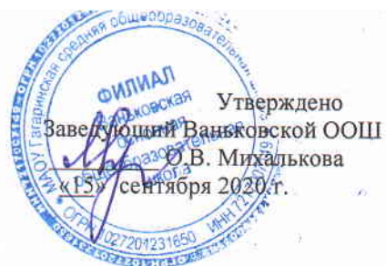
График консультаций по подготовке к ГИА учащихся 9 класса в I полугодии 2020-2021 учебного года