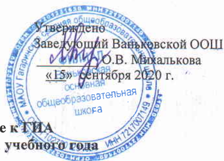
График консультаций по подготовке к ГИА учащихся 8 класса в I полугодии 2020-2021 учебного года